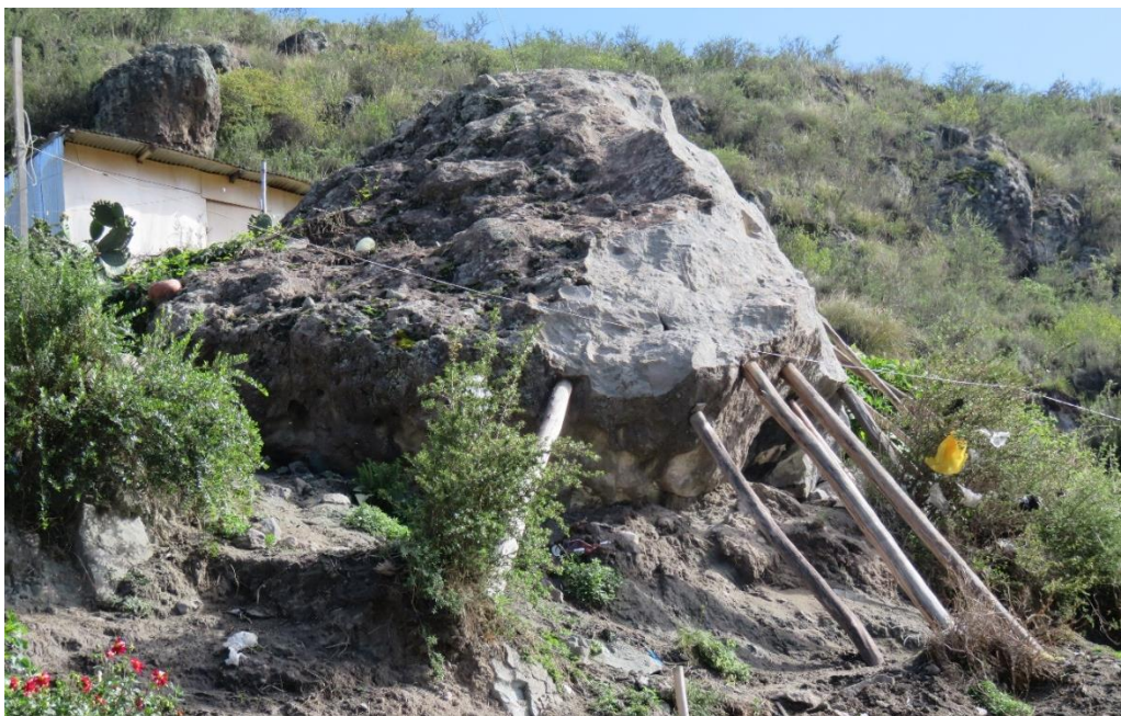
FOTOGRAFÍA N° 4. Se observa la roca suelta, que se encuentra apuntalada para evitar mayores desplazamientos.