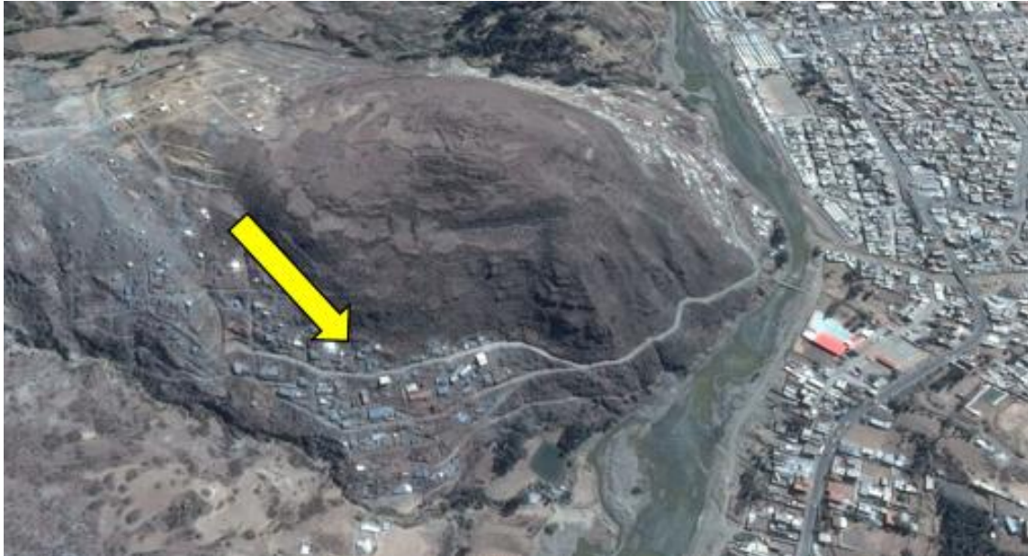
FIGURA N°1. Imagen satelital con vista panorámica de la zona de peligro en el caserío de Quechcap.

En las laderas inferiores encontramos terrazas fluviales pertenecientes al cauce del río Santa. Dichas terrazas se presentan extensas con ligera pendiente ( 15^\circ ) de tipo planicie.