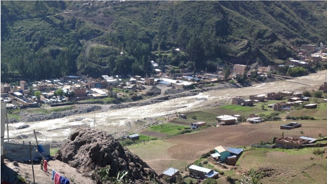
FOTOGRAFÍA N° 2. Se observa las terrazas fluviales del río Santa, ocupadas en forma desordenada.