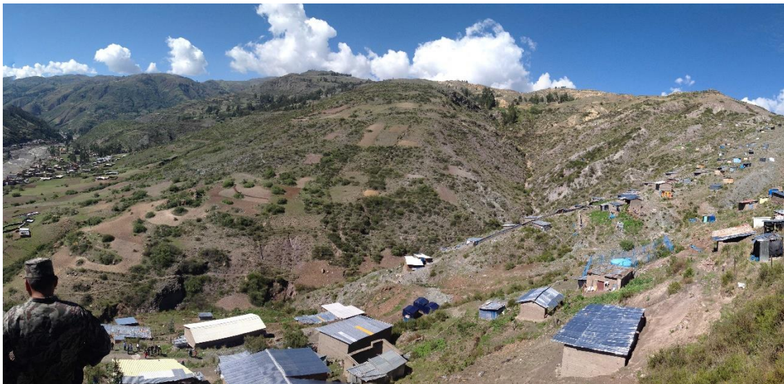
FOTOGRAFÍA N° 1. Se observa el barrio emprendedor 7 de Marzo. La ladera presenta una pendiente promedio de 35^\circ .