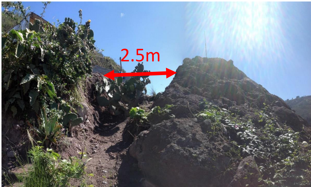
FOTOGRAFÍA N° 3. Se observa que el desplazamiento neto de la roca a la fecha es de 2.5m

También se han observado dos rocas en la parte más alta a unos 70 m aproximadamente por encima de la anterior, donde también se ha identificado el peligro que representan para estas viviendas; estas rocas de aproximadamente 65 y 100 m 3 respectivamente también deberán ser removidas y mitigar así el riesgo potencial que representaría el desprendimiento de las mismas.