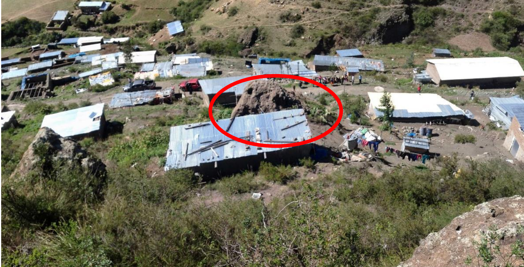
FOTOGRAFÍA N° 4. Se observa la roca suelta y una vista panorámica de las casas ladera abajo que pueden ser dañadas por las caídas de los bloques superiores.